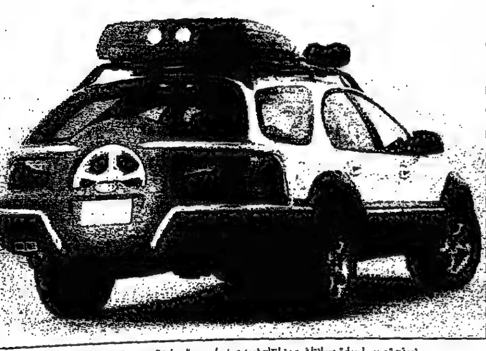
موتور جيبسي اسبقرة مساندا في من لانتاج فورد عرض اسس. والسيارة الجديدة ذات اربعة عجلات ممتعة وتبلغ سعها محركها 344 وتتميز بقدرتها على السير على الطرقات الوعرة.